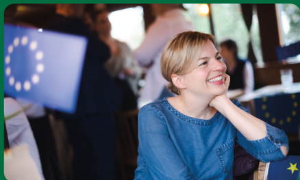
Katharina Schulze MdB Fraktionsvorsitzende im Bayerischen Landtag

„Bei dieser Europawahl sind wir alle gefragt, um den drohenden Rechtsrutsch abzuwenden. Alle Bürgerinnen und Bürger sollten diese Chance nutzen und der Zukunft eine Stimme geben. Denn ein starkes und geeintes Europa bewirkt so viel. Von der klimaneutralen Wirtschaft, mehr Gerechtigkeit und Freiheit bis zu einer europäischen Verteidigungspolitik für mehr Sicherheit – machen wir, was uns schützt!“