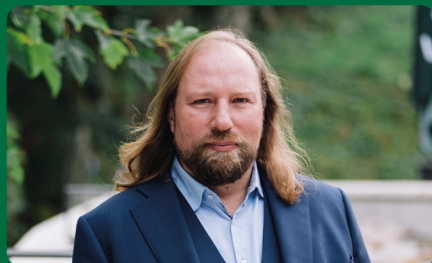
Dr. Anton Hofreiter MdB Europaausschuss-Vorsitzender im Deutschen Bundestag

„Die Europawahl 2024 ist so wichtig wie keine zuvor. Es geht um die Handlungsfähigkeit der Europäischen Union in schwierigen Zeiten und um eine Mehrheit für die demokratischen Kräfte im Europaparlament. Die grüne Fraktion muss so stark wie möglich werden, damit die EU weiter der Motor für Klimaschutz, grüne Innovationen und nachhaltiges Wirtschaften bleibt. Davon profitiert auch der Landkreis München.“